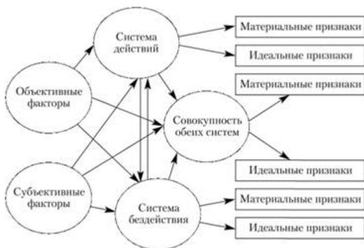
Рисунок 3. Схема системного понимания способа совершения преступления

Способ совершения преступления – это объективно и субъективно обусловленная структура действий субъекта, до, в момент, а также после осуществления им правонарушения, оставляющая разного вида особые следы вовне, которые позволяют при помощи ряда криминалистических приемов и методов составить мнение о том, что произошло, особенностях преступного поведения преступника, его конкретных личностных свойств.