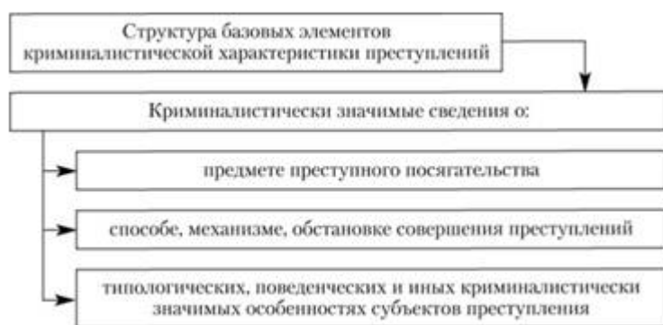
Рисунок 2. Система базовых частей криминалистической характеристики правонарушения

В составе элементов криминалистической характеристики правонарушений содержатся данные об интересных для криминалиста свойствах правонарушения. Вне зависимости от типа правонарушения криминалистически важные признаки в характеристике типа и конкретного правонарушения в большинстве случаев находятся в информации о предмете правонарушения, методе, способе и условиях осуществления правонарушения, а также в специфике их субъектов, имеющих типологический и поведенческий характер. Помимо этого для ряда типов, групп правонарушений, учитывая криминалистические потребности, данный ряд признаков может содержаться также и в информации о личностной специфике потерпевшего и в специфике их взаимоотношений с субъектом правонарушения, особенностях организованной преступной группы, причинах правонарушения, оттенке наступившего преступного результата и др.