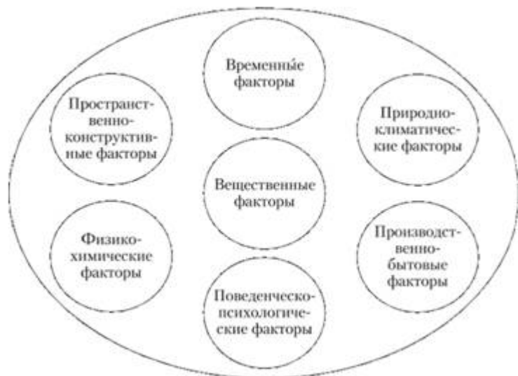
Рисунок 4. Структура обстановки осуществления правонарушения

Обстановка совершения преступления – это система различных связанных между собой объектов, процессов и явлений, которые служат характеристикой места, времени, вещественных, природно-климатических, производственных, бытовых и других условий окружающего мира. А также это ряд других факторов объективной реальности, которые служат определением вероятности, условий и других обстоятельств для осуществления правонарушения.